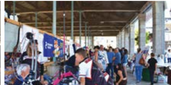
3 Septembre 2022 Forum des Associations