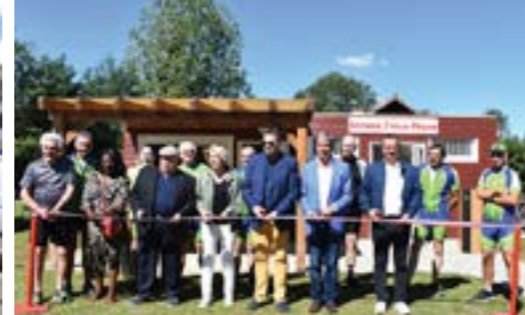
2 Juillet 2022 Inauguration de l'Accueil Cyclo-Pêche