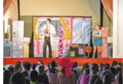
2 Mai 2022 Spectacle «Ma cousine mancapad'air» proposé aux élèves du CE2 au CM2