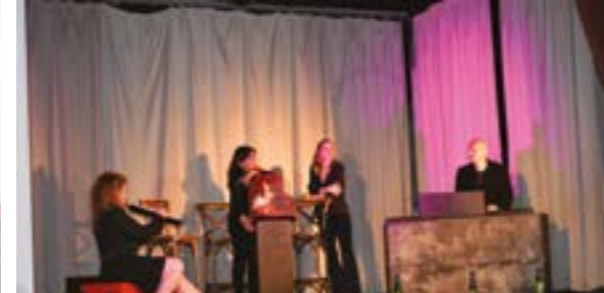
25 Juin 2022 Spectacle «Vian à tous vents»