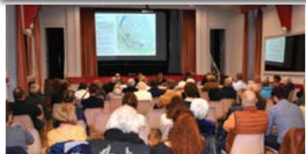
26 Avril 2022 Réunion publique de présentation de l'étude de revitalisation - opération «Bourg Centre»