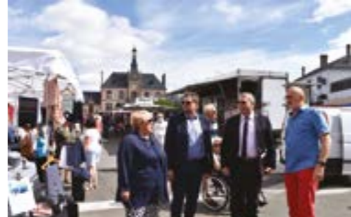
29 Juin 2022 Visite du marché par Hervé Demai, Sous-Préfet