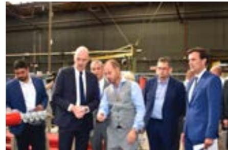
25 Juillet 2022 Visite des entreprises Denis et Latty par le Ministre de l'Industrie, Roland Lescure