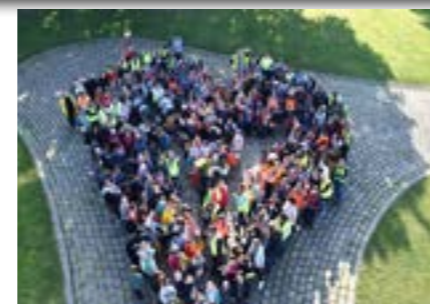
26 Avril 2022 Parcours du Coeur scolaire