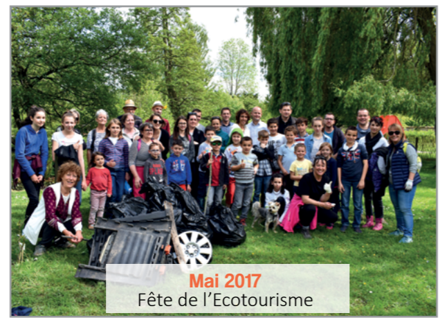
Mai 2017 Fête de l'Écotourisme