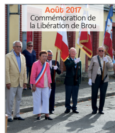
Août 2017 Commémoration de la Libération de Brou