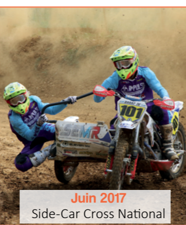
Juin 2017 Side-Car Cross National