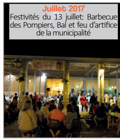
Juillet 2017 Festivités du 13 juillet: Barbecue des Pompiers, Bal et feu d'artifice de la municipalité