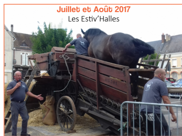
Juillet et Août 2017 Les Estiv'Halles