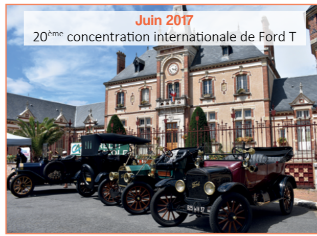
Juin 2017 20 ème concentration internationale de Ford T