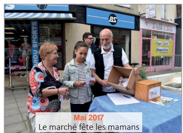
Mai 2017 Le marché fête les mamans