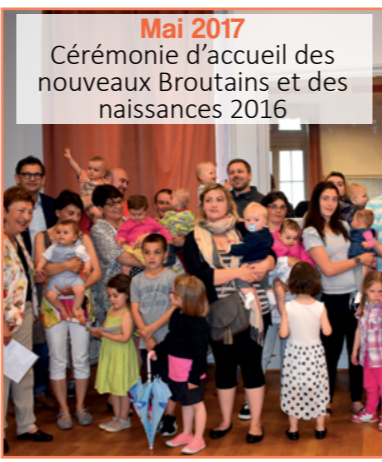
Mai 2017 Cérémonie d'accueil des nouveaux Broutais et des naissances 2016