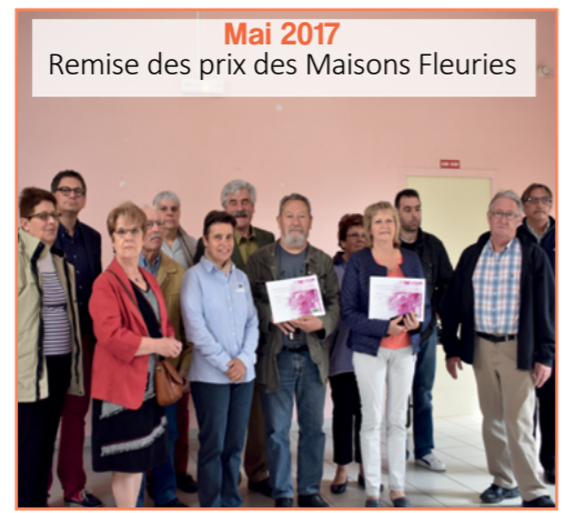
Mai 2017 Remise des prix des Maisons Fleuries