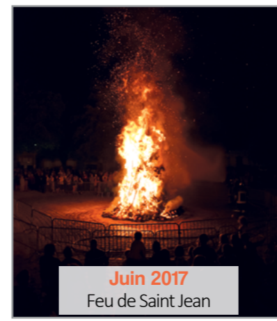
Juin 2017 Feu de Saint Jean