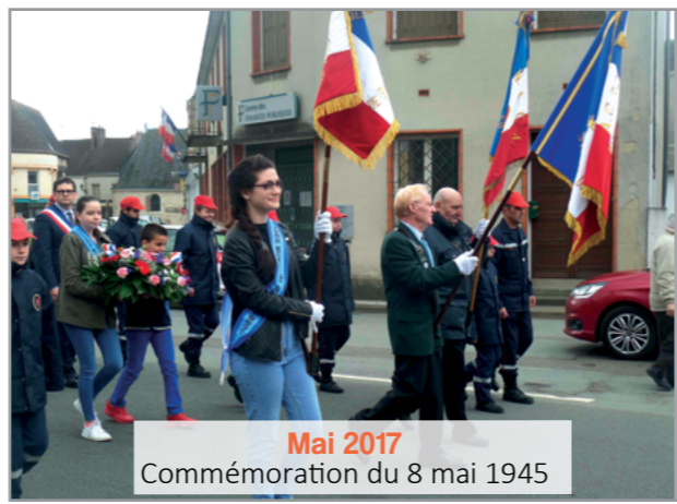
Mai 2017 Commémoration du 8 mai 1945