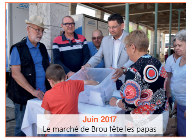
Juin 2017 Le marché de Brou fête les papas