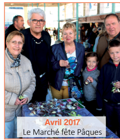
Avril 2017 Le Marché fête Pâques