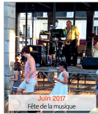
Juin 2017 Fête de la musique