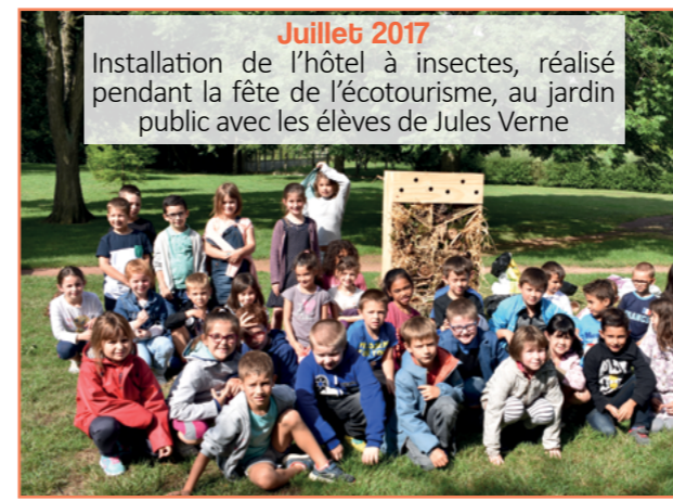
Juillet 2017 Installation de l'hôtel à insectes, réalisé pendant la fête de l'écotourisme, au jardin public avec les élèves de Jules Verne